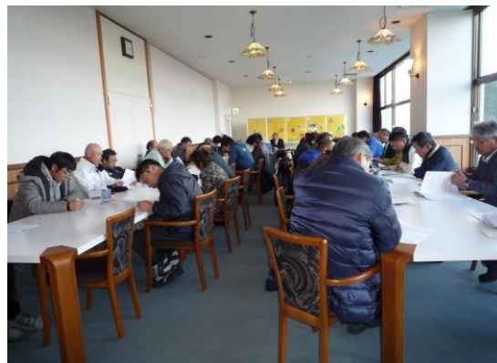
従業員の打合せ会議にて安全教育を実施