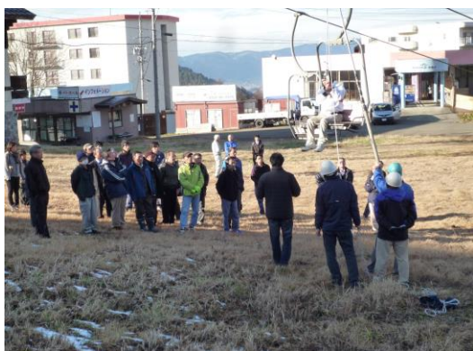
リフト従業員とパトロールによる救助訓練